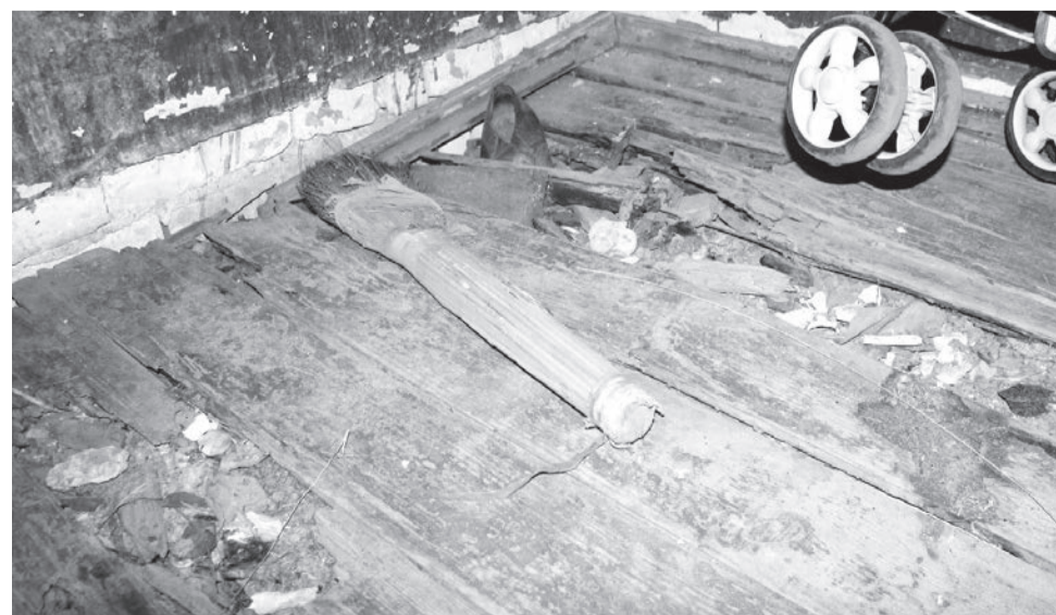
● Пол прогнил до основания

рубля за содержание и ремонт 1 квадратного метра