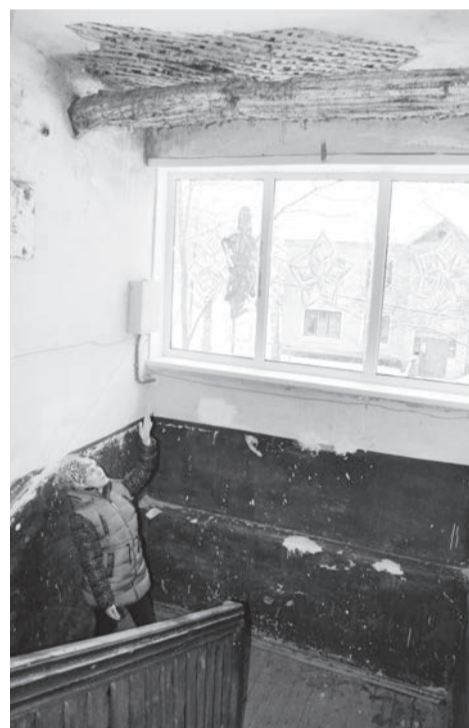
● «Звёздочки» штукатурки продолжают падать